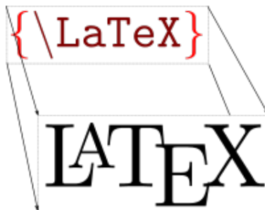
FIGURE 1 – L A T E X-WikiBook logum

ut sollicitudin erat. Integer sem est, fermentum vel scelerisque a, facilisis tincidunt felis. 1 Proin iaculis eros et leo pharetra lobortis. Etiam ultrices erat nulla, vel facilisis magna facilisis convallis. Donec faucibus tortor eget augue pretium varius. Quisque lobortis elit non odio bibendum, ultrices accumsan nisi venenatis. Nunc lobortis, arcu et sodales ornare, odio nunc rhoncus sem, ac malesuada sapien odio sed nibh. Nulla hendrerit egestas 2 velit, sed sodales erat cursus in. Mauris fringilla libero sit amet enim ultricies, sit amet scelerisque velit posuere. Curabitur commodo semper velit, quis vestibulum enim consectetur ut. Nam ultricies massa blandit, consequat nulla in, semper risus. Aliquam erat volutpat.